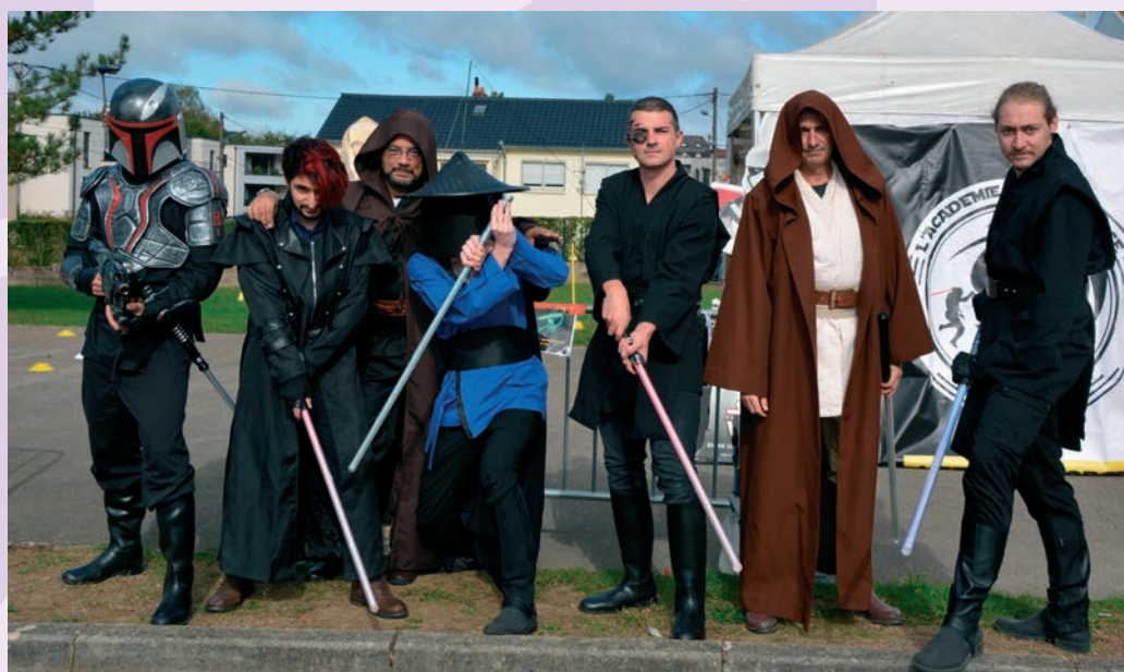
L'Académie de la Force